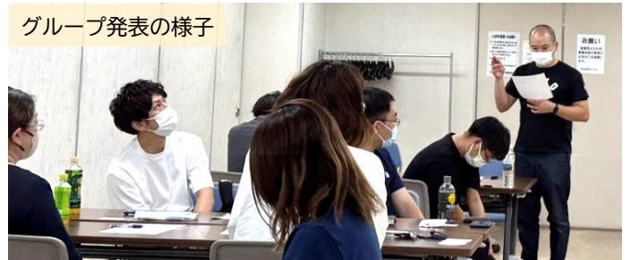
グループ発表の様子

参加した方々からは、『対面で話せた事はとても良かった』『楽しく議論できた』『緊急時の具体的な事例が聞けてよかった』『様々なケースや対応の仕方、自分の考え以外を聞いて見識が広がった』『リスクについて言葉にして、整理することで整理できた』と大変嬉しいお言葉をいただきました。