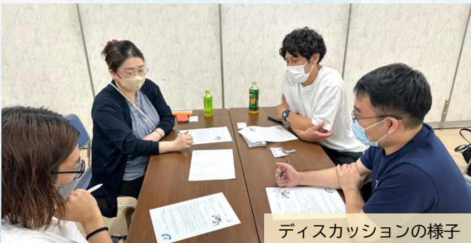
ディスカッションの様子

ガイドライン等で定められている対応方法を確認しながらも、事業所ごとに取り組んでいる対策や連携方法を共有することで、リスク管理や危険予知に向けた再認識につながりますね。